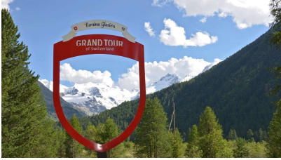
Photo Spot Bernina Glaciers