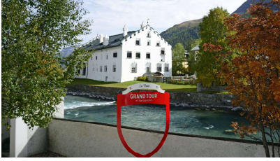
Photo Spot La Punt