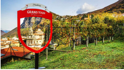
Photo Spot Mendrisiotto