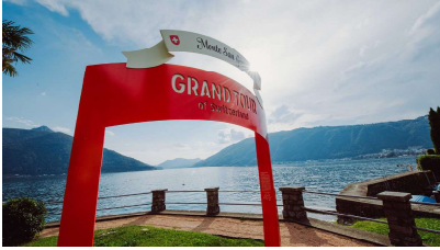
Photo Spot Monte San Giorgio