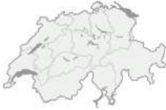
Photo Spot los siete Churfürsten

¿Podría estar Blancanieves esperándole detrás de los siete picos? Los siete Churfürsten transmiten la misma magia que los cuentos infantiles y todos los niños de Toggenburg saben cómo se llaman. Del este al oeste: Chäserrugg (2.262 m), Hinterrugg (2.306 m), Schibenstoll (2.234 m), Zuestoll (2.235 m), Brisi (2.279 m), Frümsei (2.263 m), Selun (2.205 m). Hay senderos que llevan a cada cumbre. Un destino de especial popularidad es el Chäserrugg, fácilmente accesible desde Unterwasser mediante dos teleféricos.