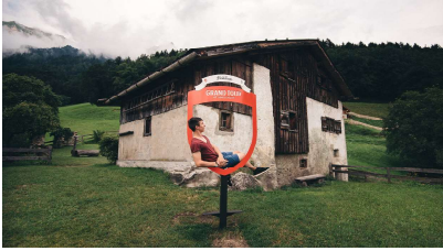
Photo Spot Casa de Heidi

El pueblo de Heidi en Maienfeld, 658 m s. n. m.