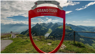
Photo Spot Säntis