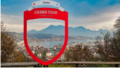
Photo Spot Lucerna