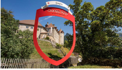
Photo Spot Gruyères