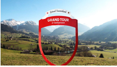
Photo Spot Gstaad Saanenland