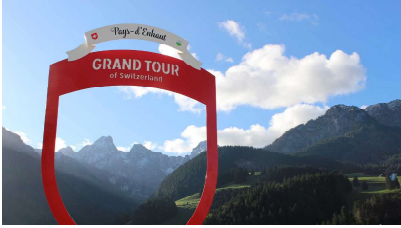
Photo Spot Pays-d'Enhaut