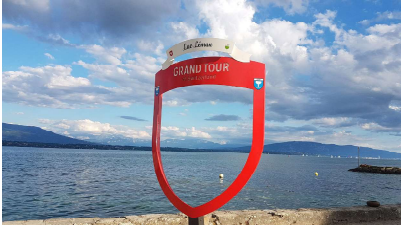
Photo Spot Lago Lemán

La Côte, Región de Nyon, Coppet, 373 m s.n.m.